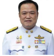
นายอนุทิน ชาญวีรกูล รัฐมนตรีว่าการกระทรวงสาธารณสุข

สำนักงานสาธารณสุขอำเภอแม่ทะ จังหวัดลำปาง (หน่วยงานภายใต้กระทรวงสาธารณสุข)